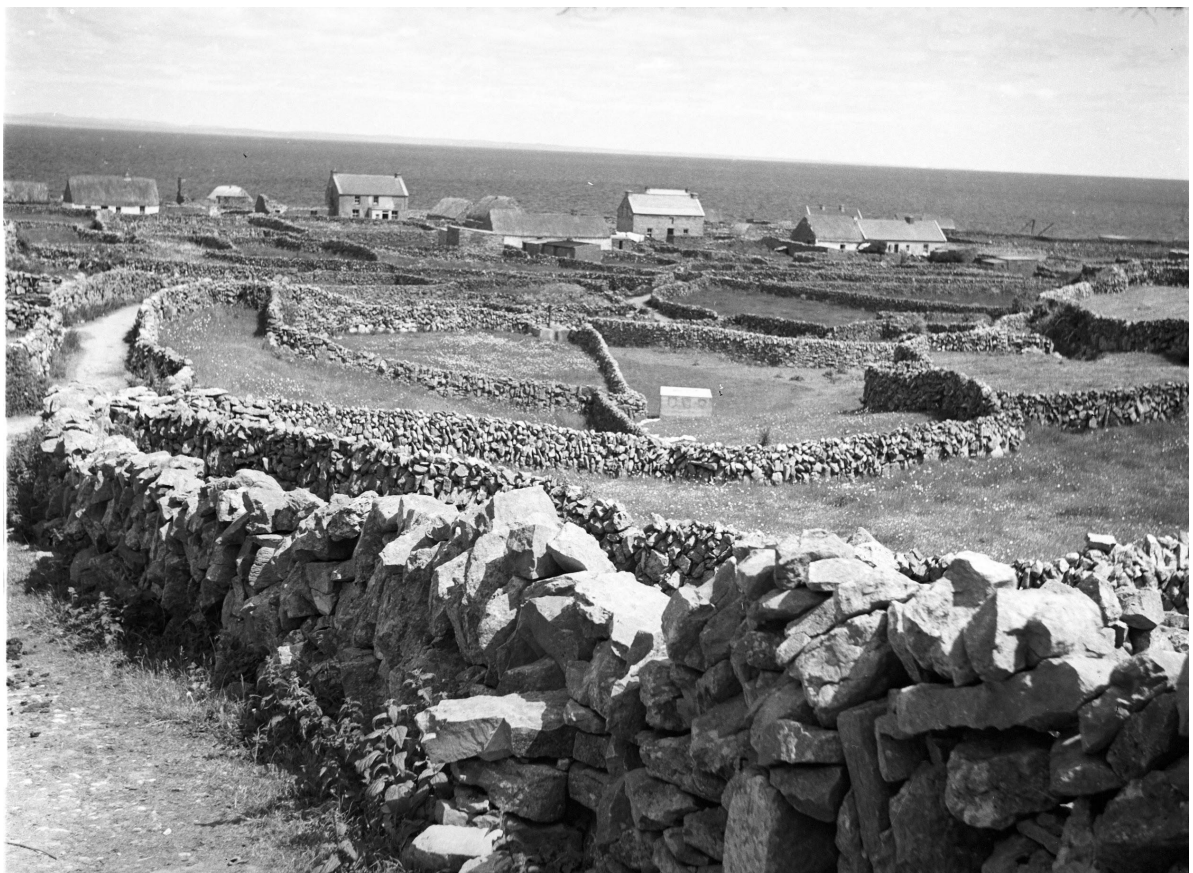
Lonnaíocht tithe ar Inis Oírr, Co. na Gaillimhe (gan dáta) A010.01.00067