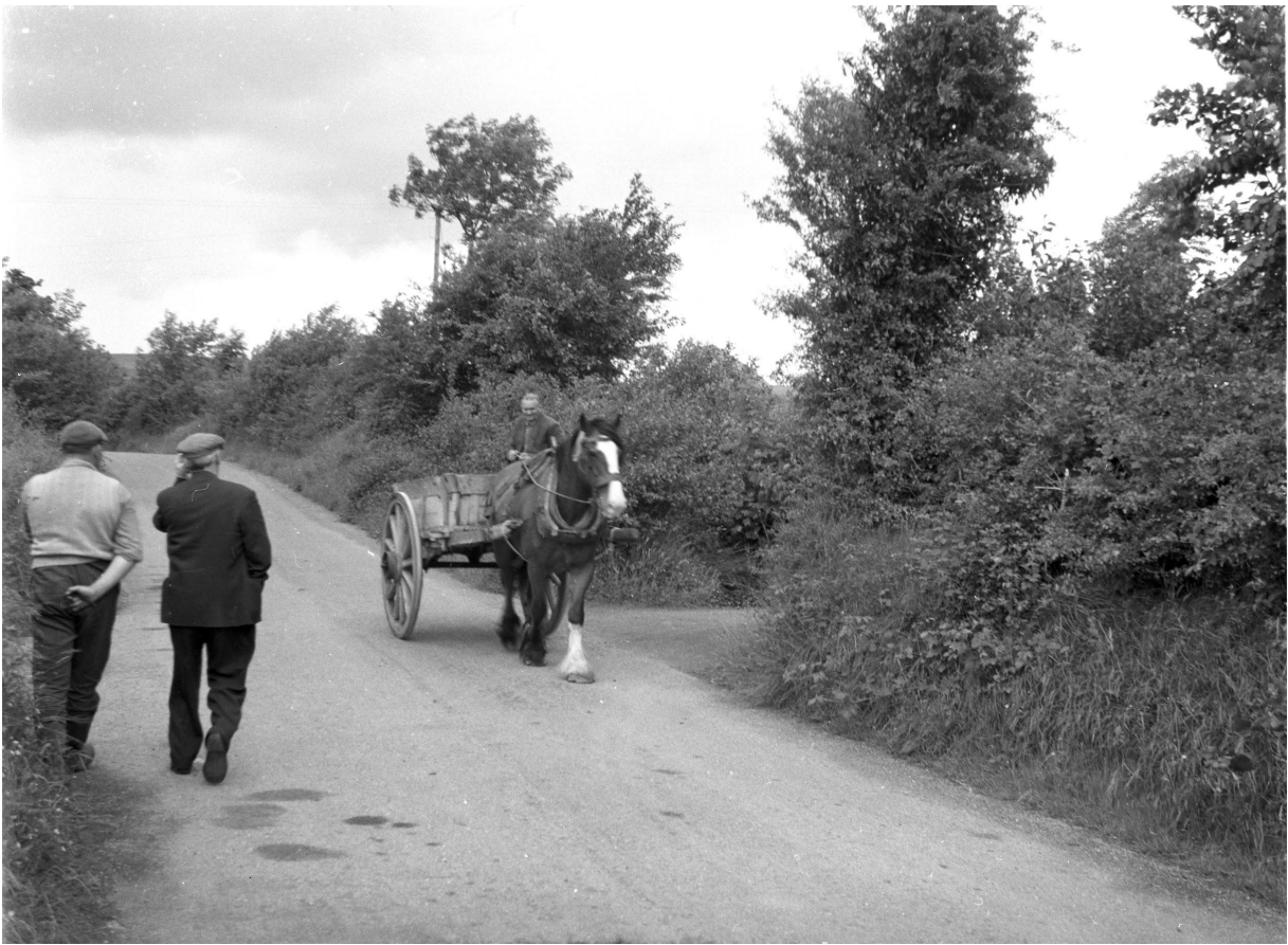
Capall agus cairt gar do Bhaile an Scotsaigh, Co. Mhuineacháin (1965) C006.31.00001