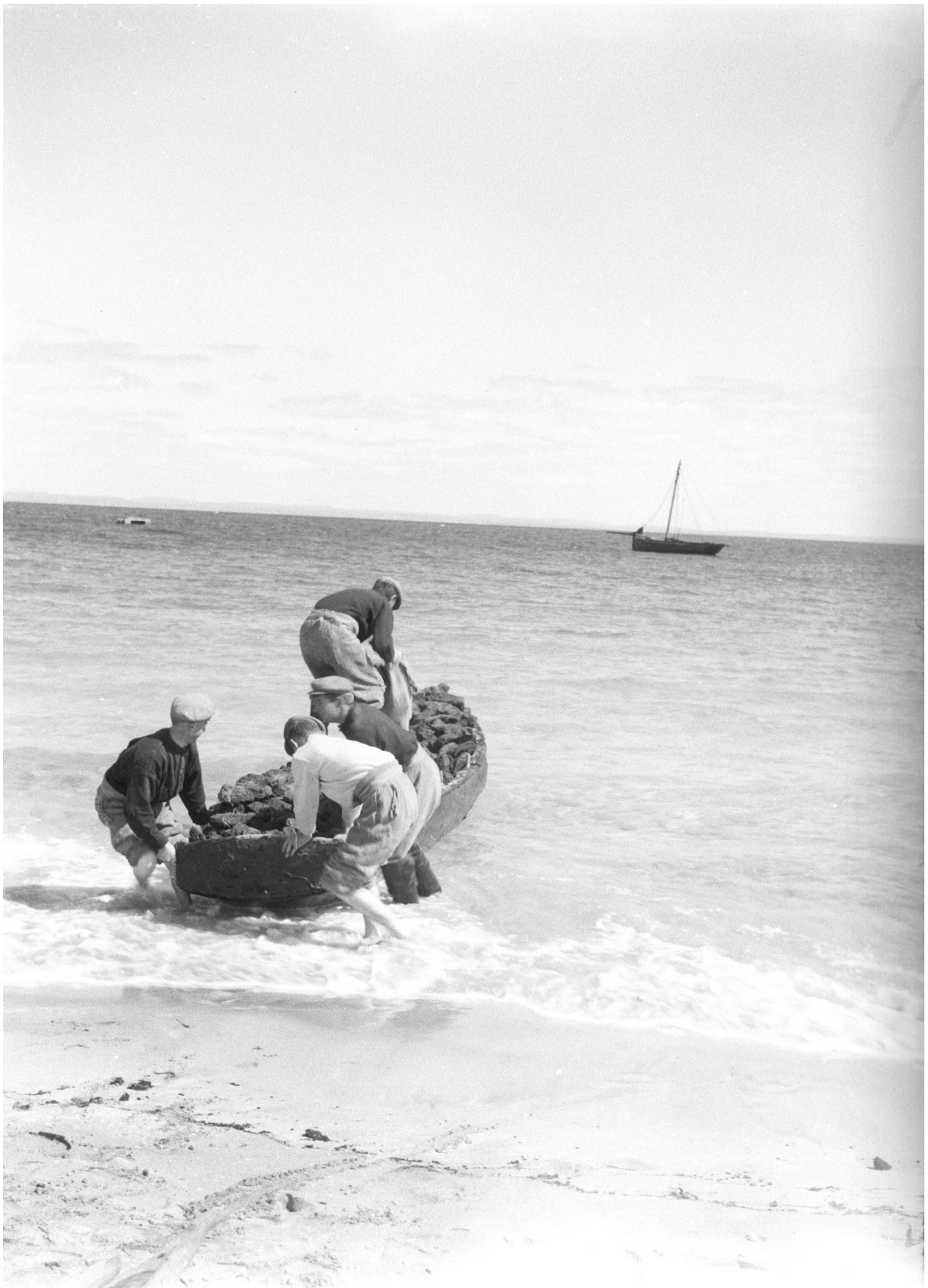
Ag tabhairt móin isteach go hInis Óírr ó bhád móna ón mórthír, Co. na Gaillimhe (1957)