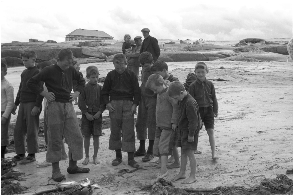
Ag iascaireacht ón trá ar Inis Oírr, Co. na Gaillimhe (gan dáta) B005.01.00033