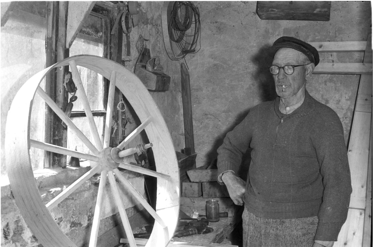
Siúinéir ag déanamh rotha, Inis Oírr, Co. na Gaillimhe (1957) B082.01.00010