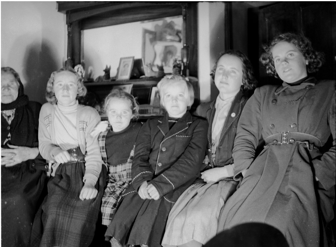
Cailíní ó theaghlaigh Duggan, McGinty agus MacNeela, Bréanascail, Acaill, Co. Mhaigh Eo (1956) M003.03.00459