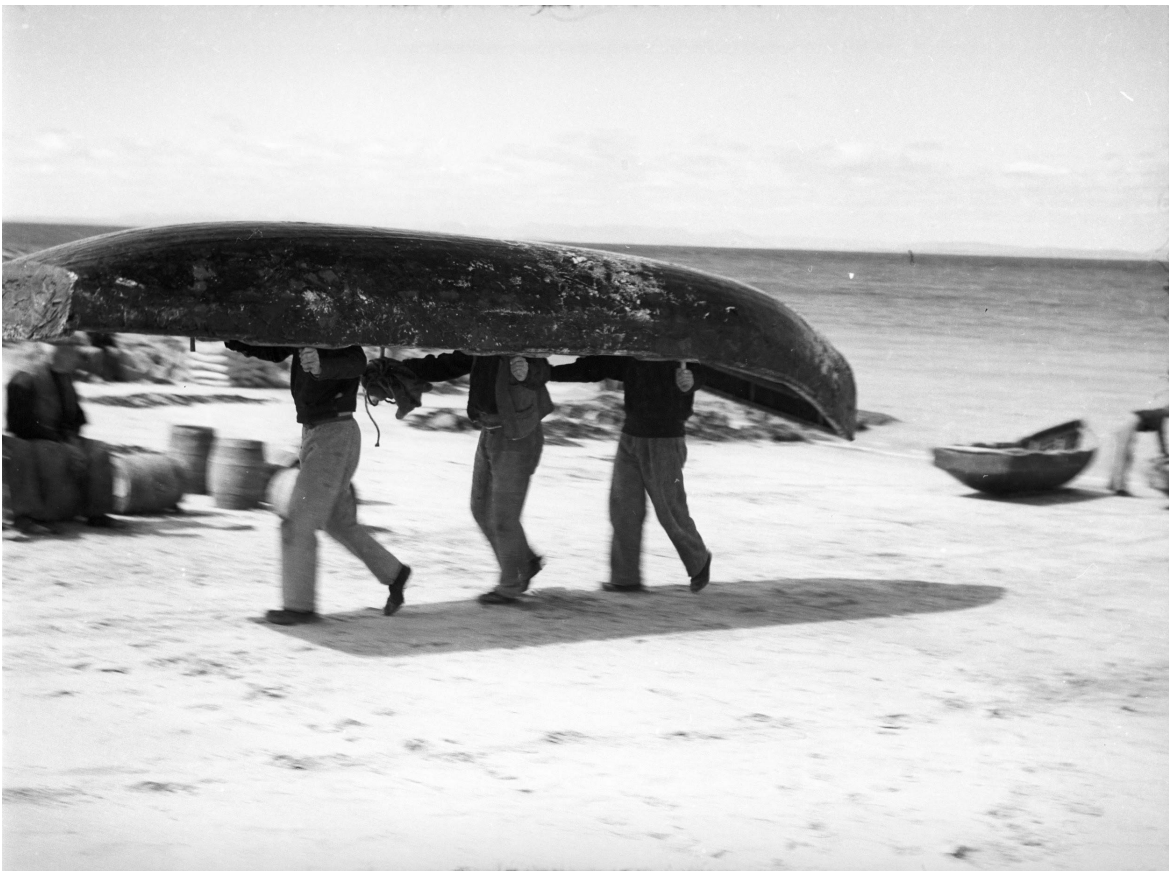
Ag iompar curaigh, Inis Oírr, Co. na Gaillimhe (1957) B006.01.00019