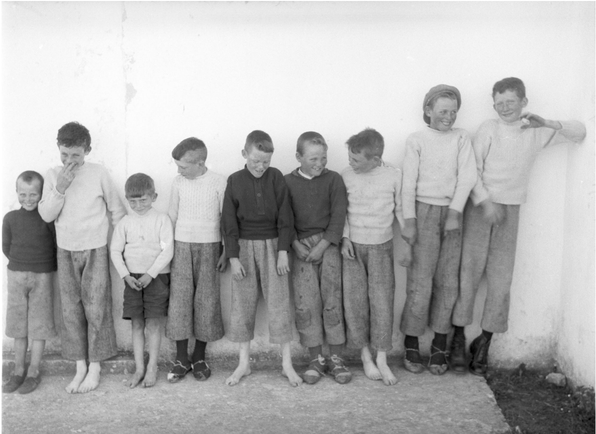
Páistí scoile, Inis Oírr, Co. na Gaillimhe (1957) M003.01.00023