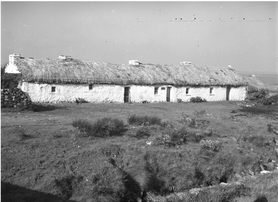
Teach ag Tóin re Gaoth, ar thaobh an bhóthair idir Mala Raithní agus Gob an Choire, Co. Mhaigh Eo (1956) A015.03.00212