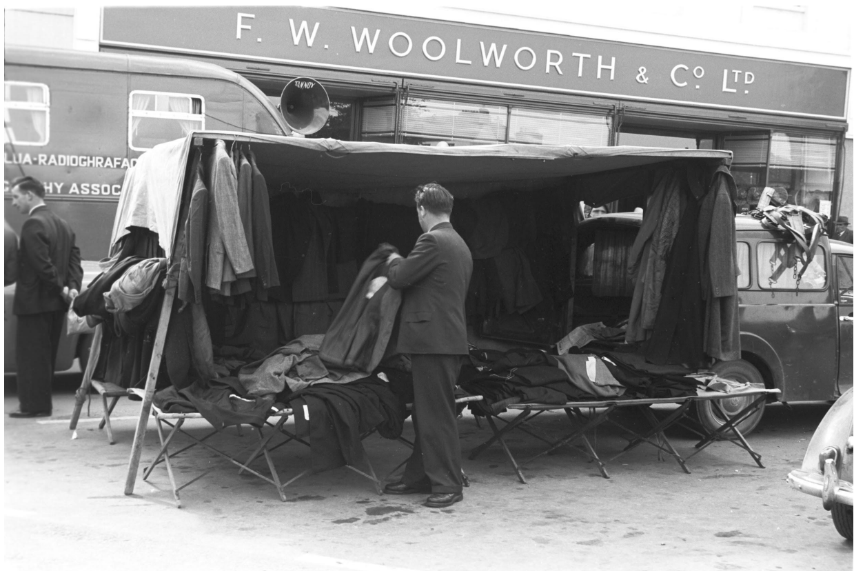
'Cheap Jacks': ag díol éadaí ar an tsráid, An Fhaiche Mhór, Co. na Gaillimhe (1958) C050.01.00050