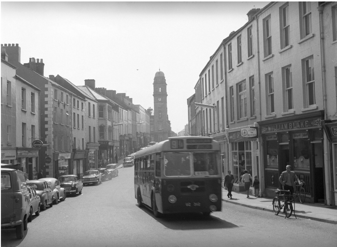
Radharc ar an tsráid in Inis Ceithleann, Co. Fhear Manach (1965) A010.30.00006