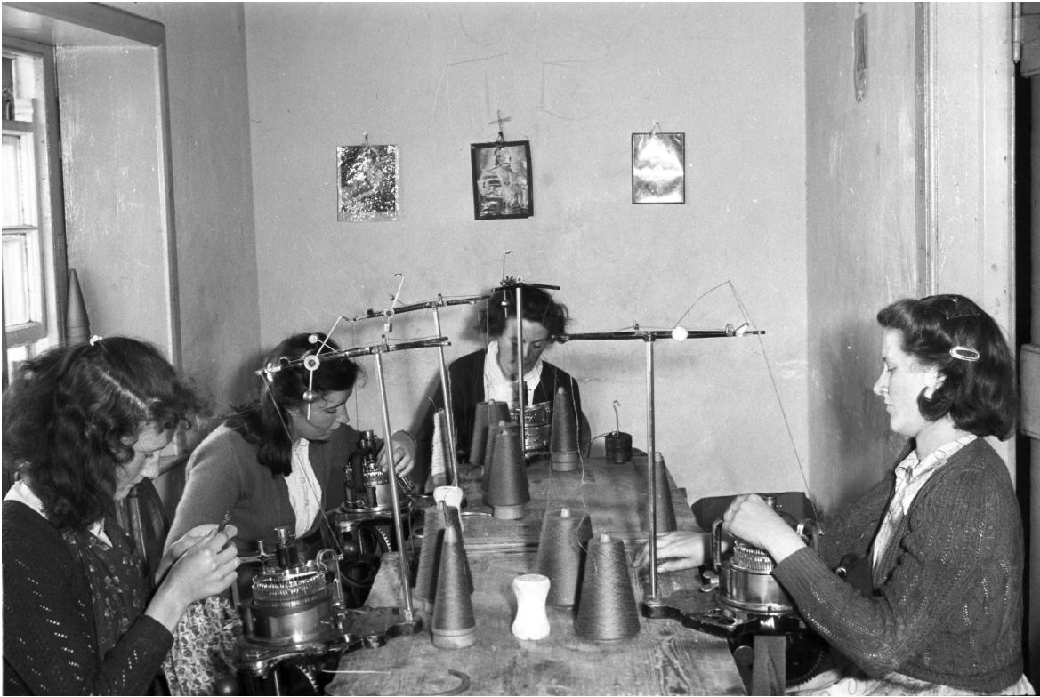
'An Factory': Ag cniotáil stocaí, Inis Oírr, Co. na Gaillimhe (1957) B066.01.00004