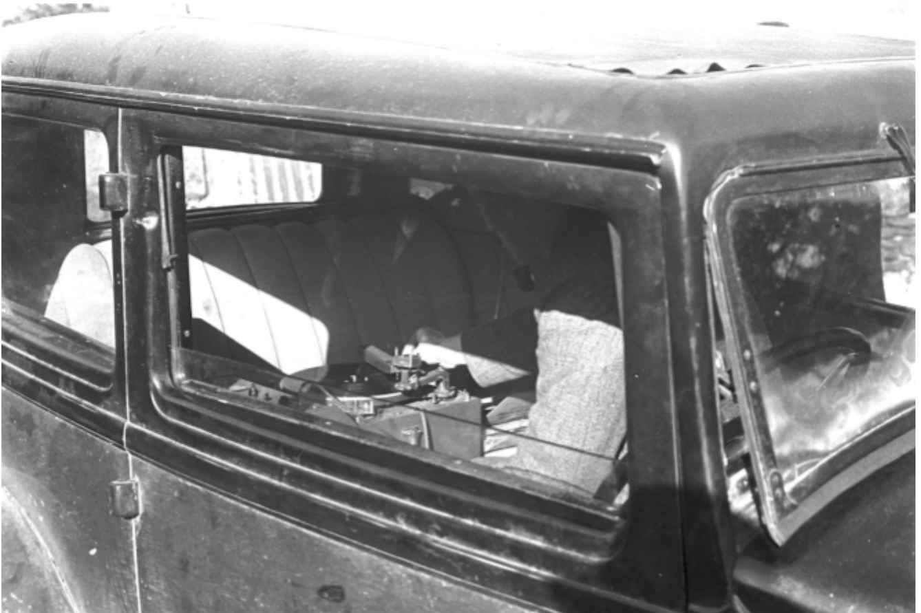
Figiúr. 01: Gléas gearrtha dioscaí sa chóras taifeadta taistil, Cluain Eachlainn, Ciarraí (1947)

and you hadn't the machine ready at all! So you had to give another beep on the horn, and so it went on."