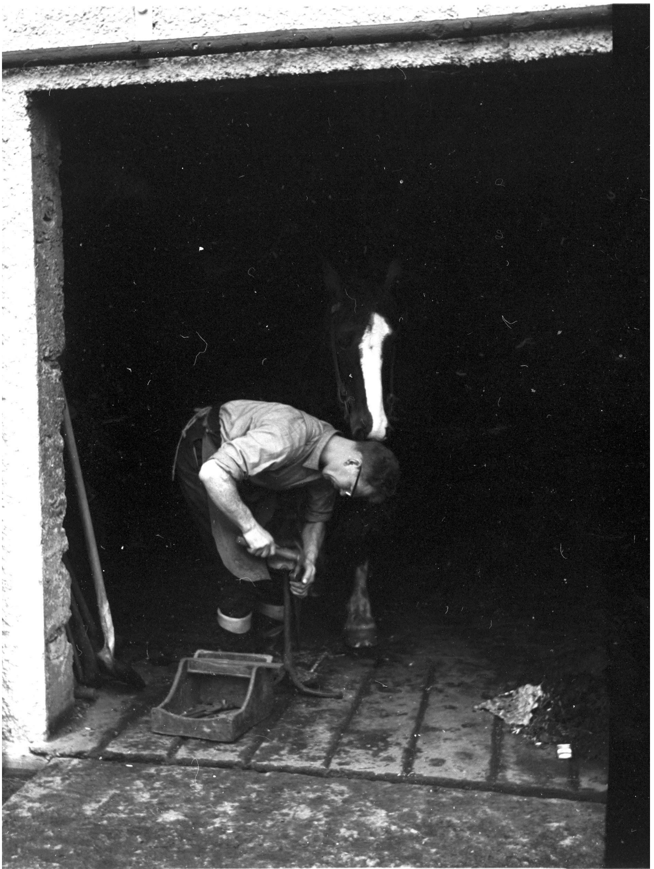
Ceárta in Áth Cinn, Co. na Gaillimhe (1965) B070.01.00008