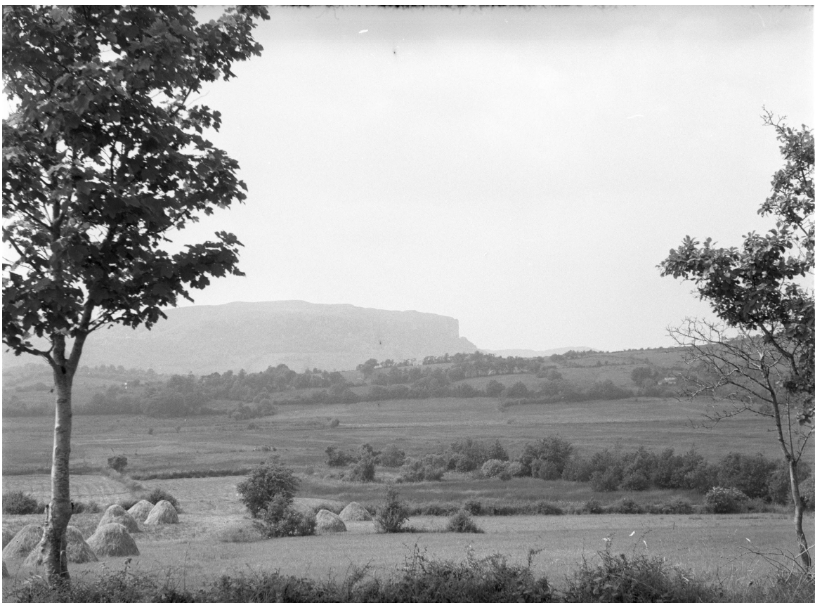
Tírdhreach thart ar Achadh Caorthainn, Co. Fhear Manach (1965) A001.30.00010