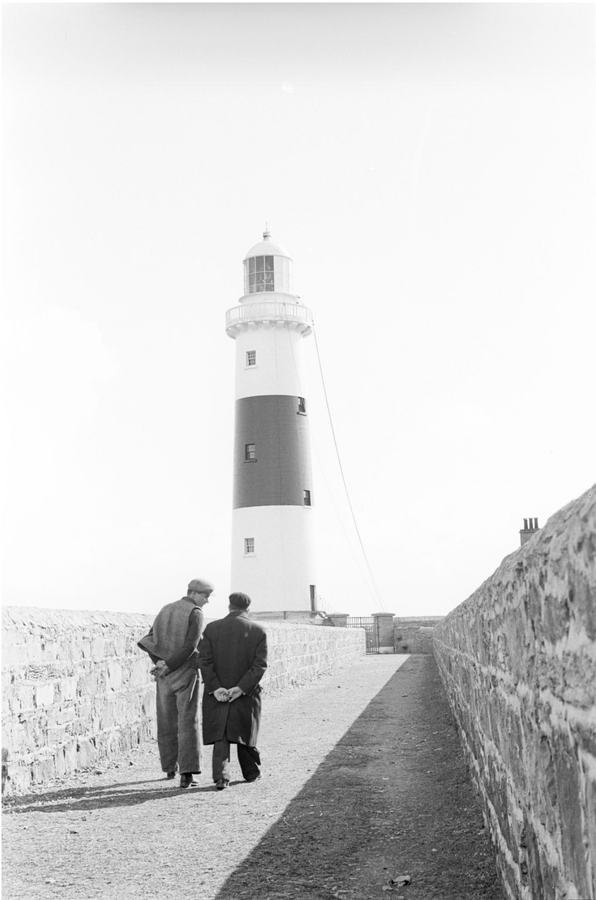
Radharc ar an teach solais, Inis Oírr, Co. na Gaillimhe (1958) A001.01.00111