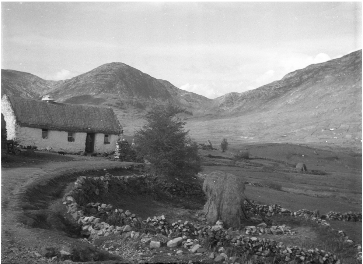
Teach ag Tamhnach Mór, Co. na Gaillimhe (gan dáta) A010.01.00068